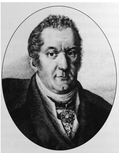
Ефрем Осипович Мухин.