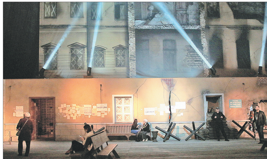
«Миллениум» стал частичкой блокадного Ленинграда.

ные, сохранившиеся в северной столице по сей день: «При артобстреле эта сторона улицы наиболее опасна». Члены общественной организации «Жители блокадного Ленинграда», осматривая экспозицию, не скрывали слез.