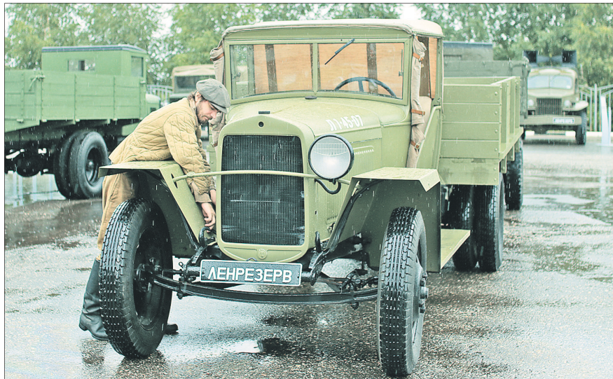
На площадке перед КЗЦ «Миллениум».

Лишь четыре дня работала в Ярославле выставка «Одна страна – одна Победа!», приуроченная к 76-й годовщине начала блокады Ленинграда. И за четыре дня ее успели посетить тысячи ярославцев.