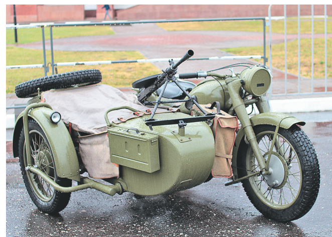
Мотоцикл времен Великой Отечественной.