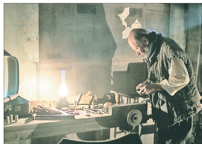
Второй год блокады.

300 тысяч умирающих от истощения ленинградцев.