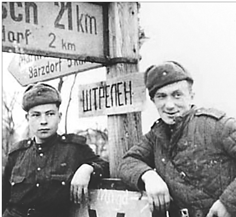
Война для Алексея Смирнова закончилась весной 45-го.

В год 75-летия Победы ярославцы отмечают еще одну памятную дату. 28 февраля исполнилось 100 лет со дня рождения нашего известного земляка ветерана Великой Отечественной войны, заслуженного артиста РСФСР Алексея Макаровича Смирнова. Торжественные мероприятия прошли в Ярославле, в Данилове и на аэродроме Левцово, где, как и его герой из фильма «В бой идут одни старики», встречает и провожает самолеты бронзовый Макарыч