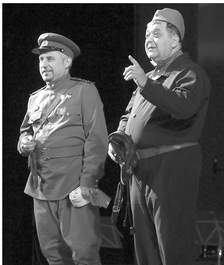
Театральная постановка «Макарыч. Будем жить!».