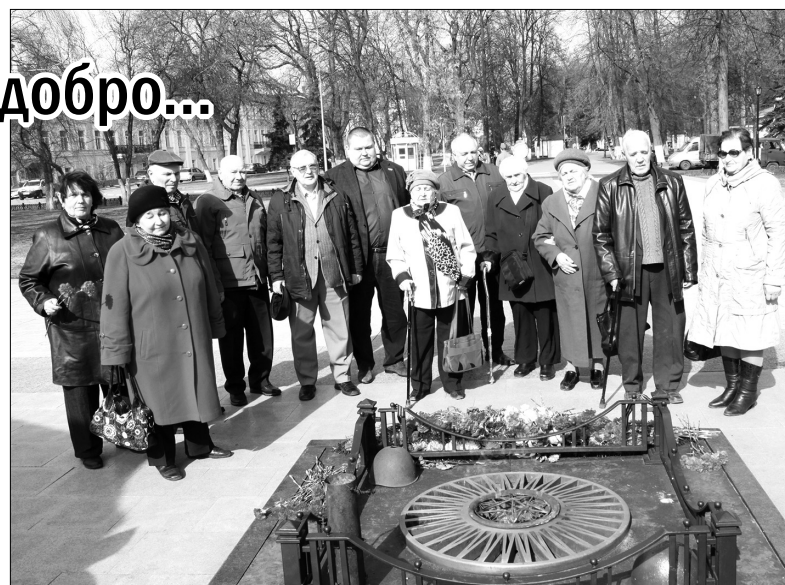
Ветераны у Вечного огня.