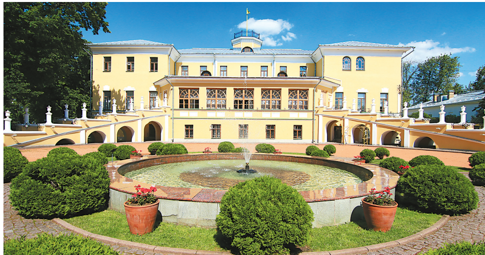
↓ Губернаторский дом со стороны Ильинской площади.