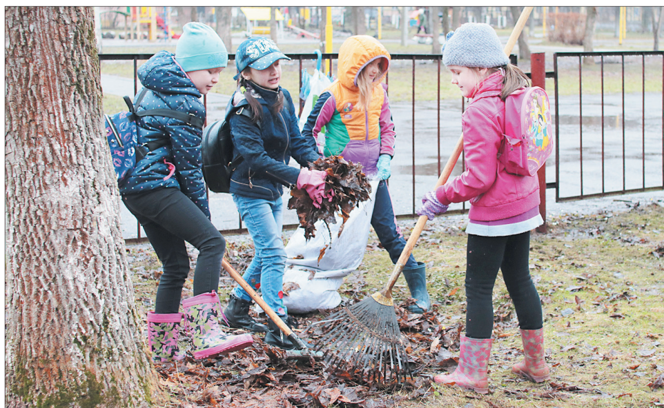
Второклассники школы №76 за работой.

Более 43 тысяч ярославцев во всех районах города, несмотря на дождь и ветер, 21 апреля вышли на общегородской субботник.