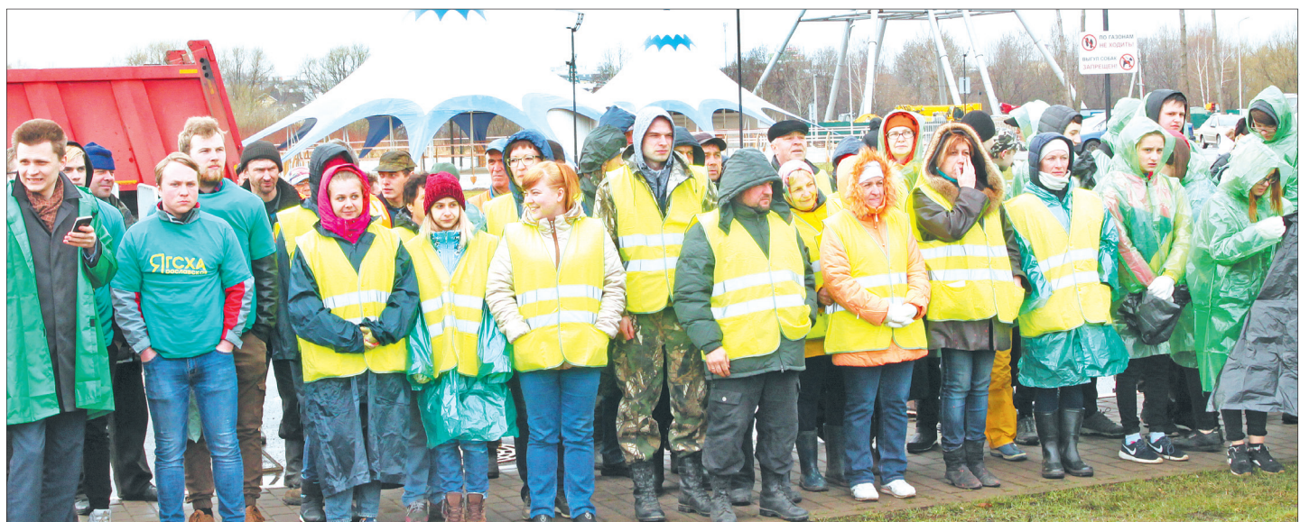
Приступаем к уборке.