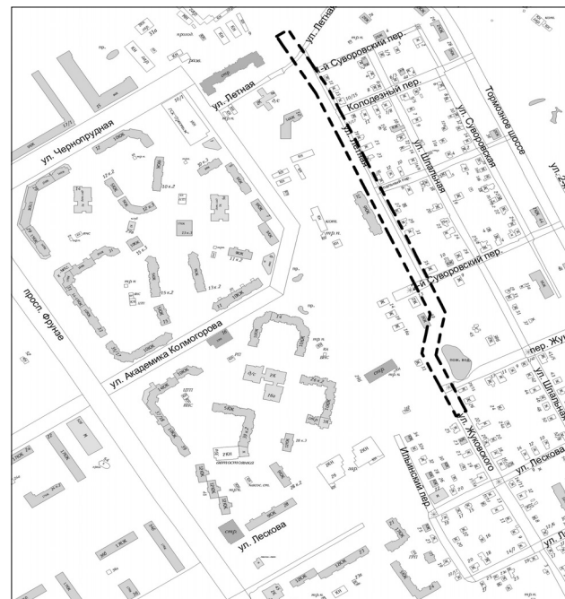
Схема границ территории линейного объекта – автомобильной дороги ул. Летная (на участке от ул. Чернопрудная до ул. Лескова) во Фрунзенском районе города Ярославля

--- граница территории для подготовки документации по планировке территории.