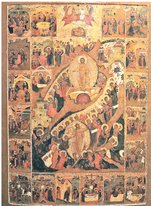
Икона «Воскресение с сошествием во ад».