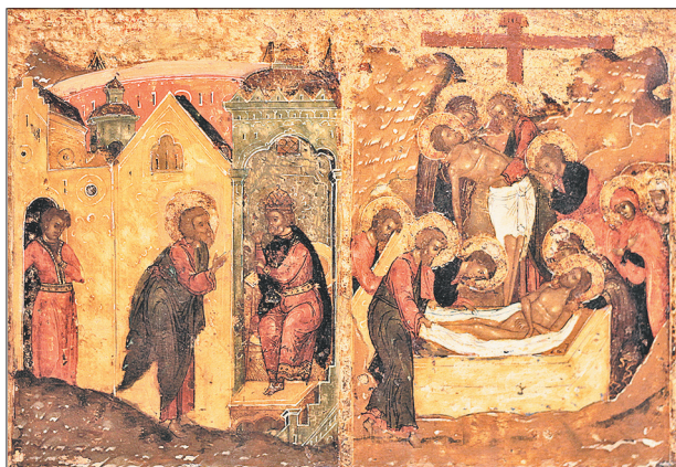
Клейма иконы «Воскресение с сошествием во ад». Фрагмент иконы.

— В Германии, Голландии, Италии, меньше во Франции и США.