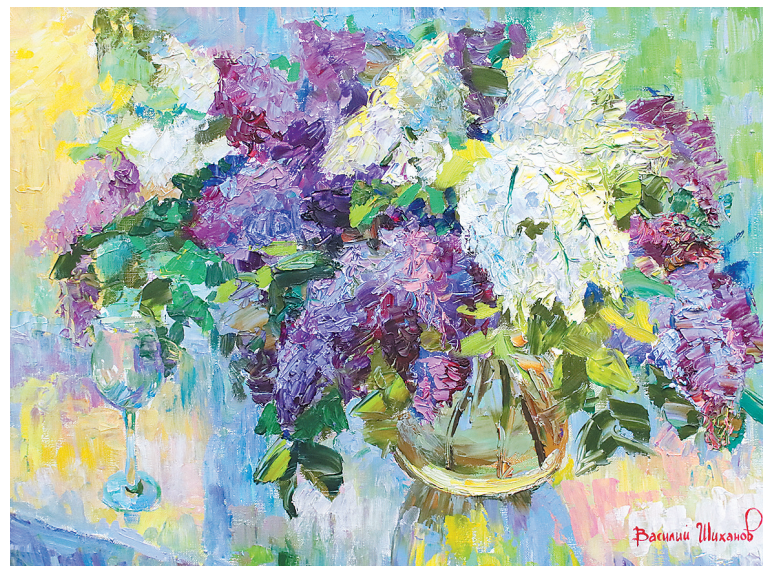
↓ «Натюрморт с сиренью».