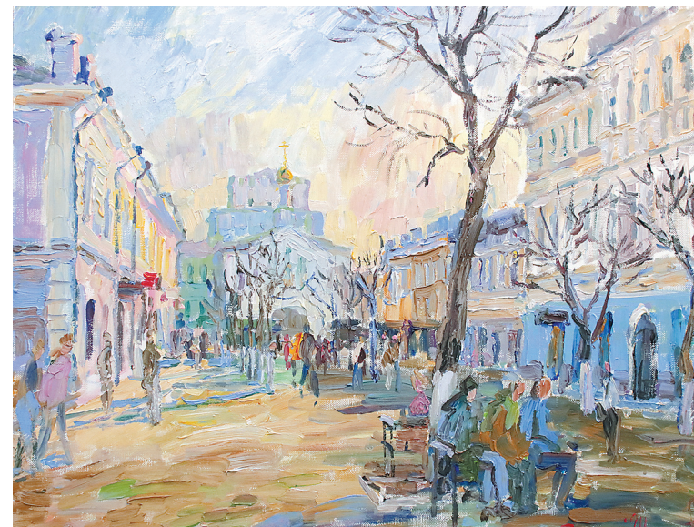
↓ «Весной на улице Кирова».