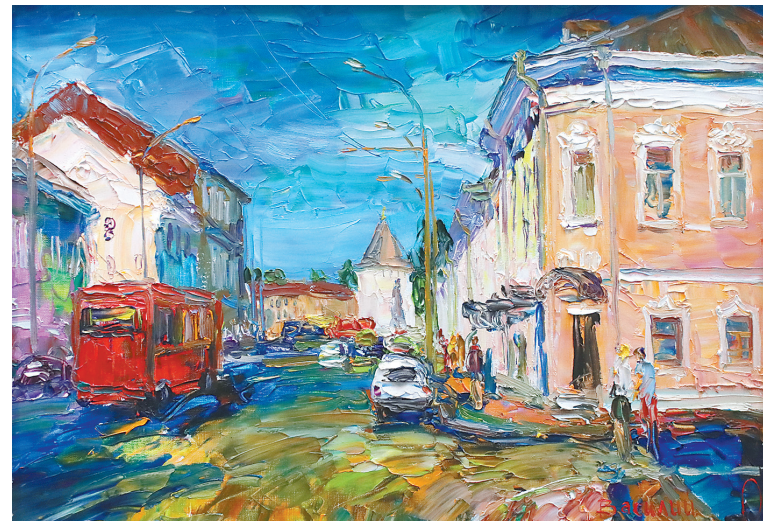
↓ «Улица Большая Октябрьская».