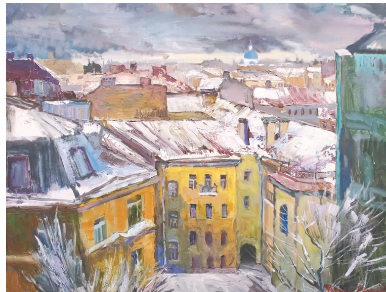
↓ «Крыши и дворики Питера».