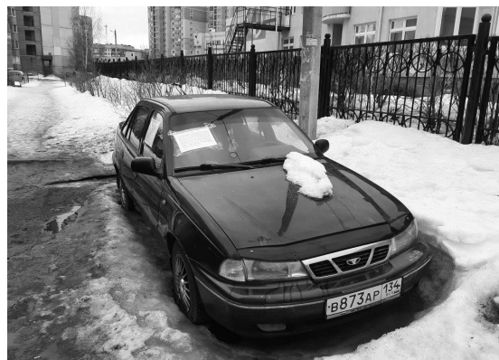
Транспортное средство расположено по адресу: ул. Лескова, д. 28, корп. 2.