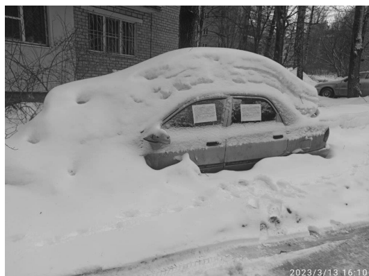
Транспортное средство расположено по адресу: ул. Ньютона, 22.