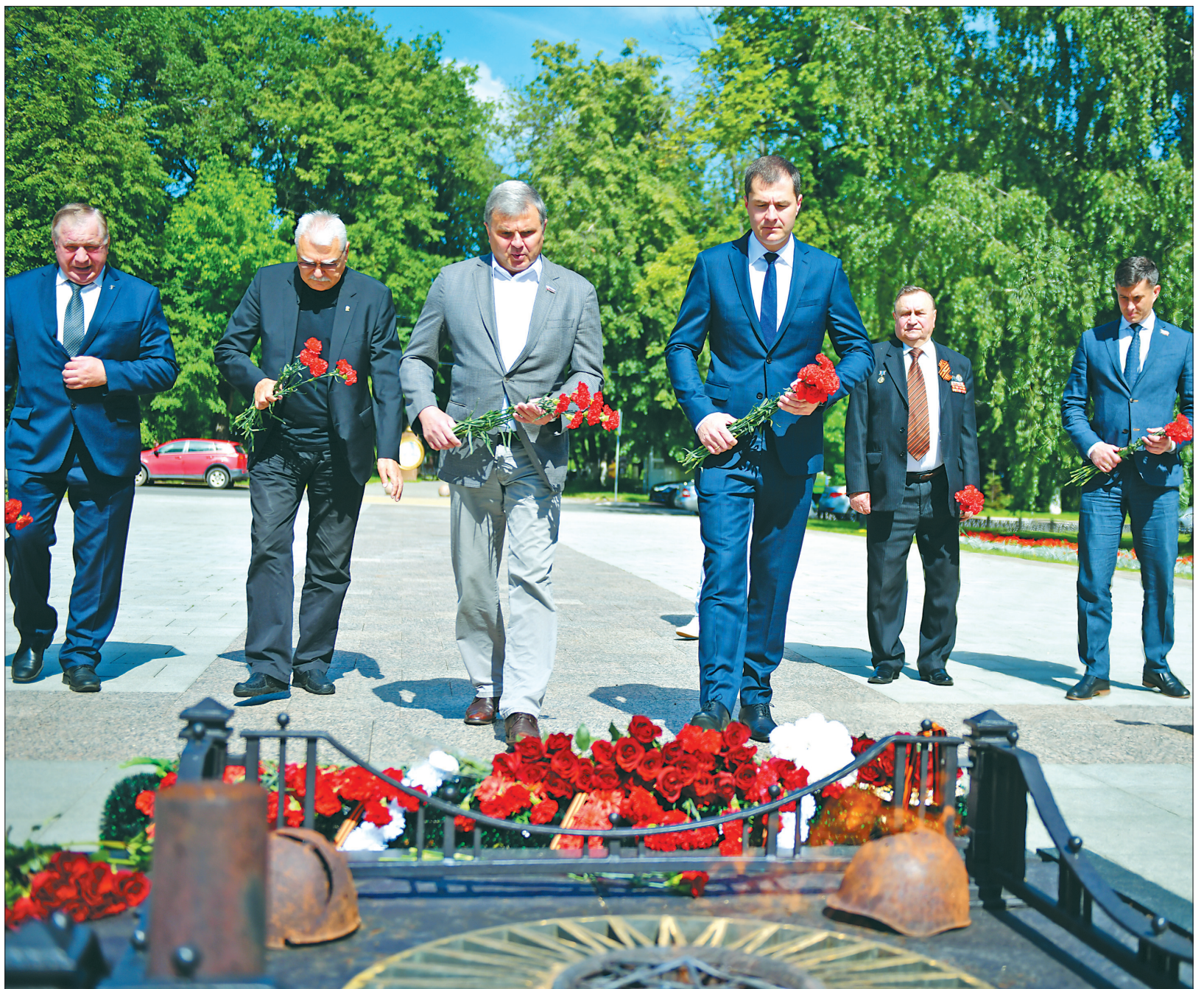
22 июня цветы к Вечному огню возложили первые лица города.

Ольга СКРОБИНА