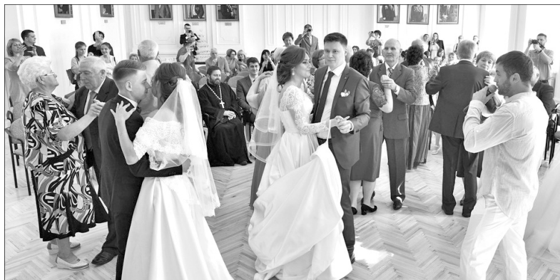
Танцы по душе всем.

6 июля в Большом зале мэрии поздравляли и молодоженов.