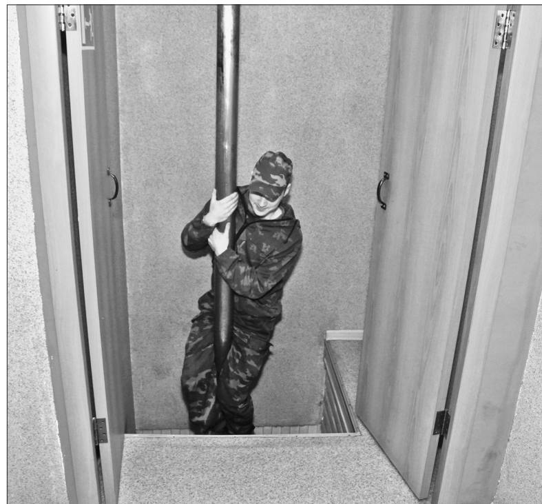
Так пожарные спускаются к машинам.