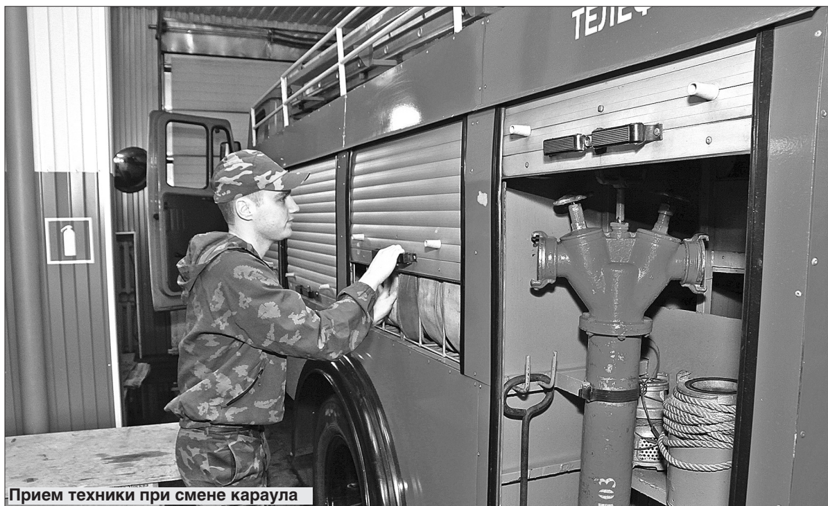
Прием техники при смене караула