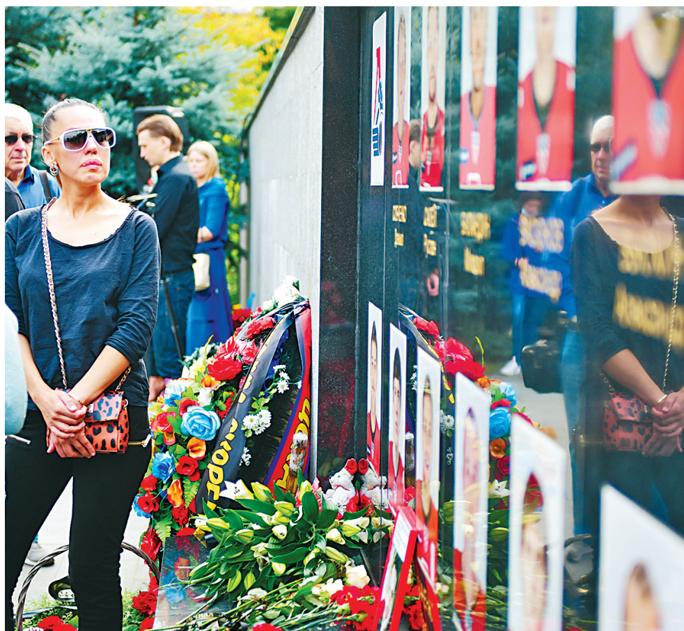
↓ Почтить память любимой команды пришли сотни болельщиков.