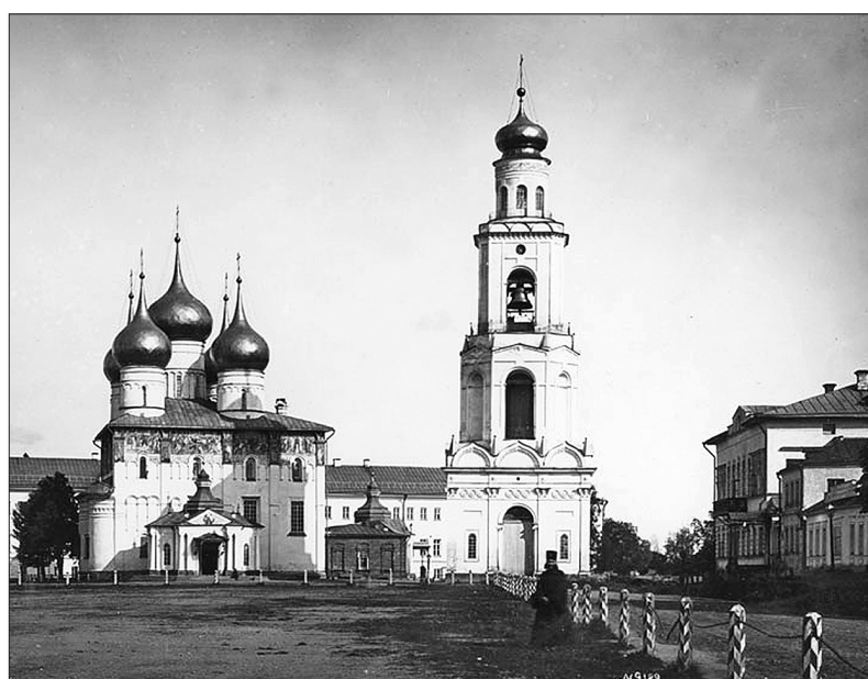
Ярославль. 1881 год.