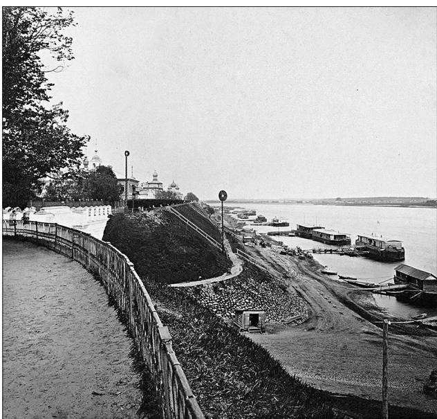
Часть набережной у Семеновского съезда.