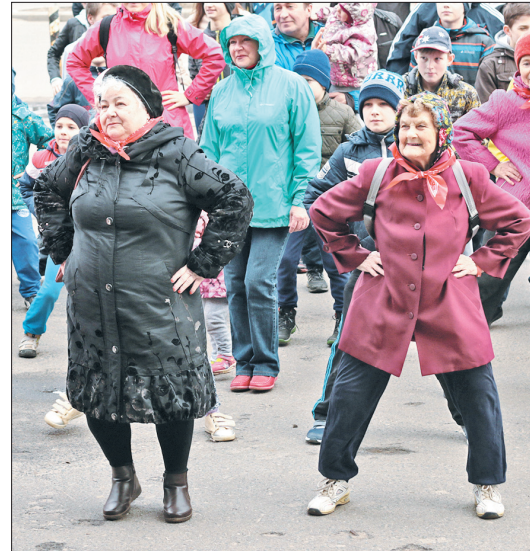
С молодецким задором.