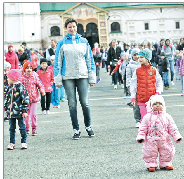
Первые шаги в спорте.