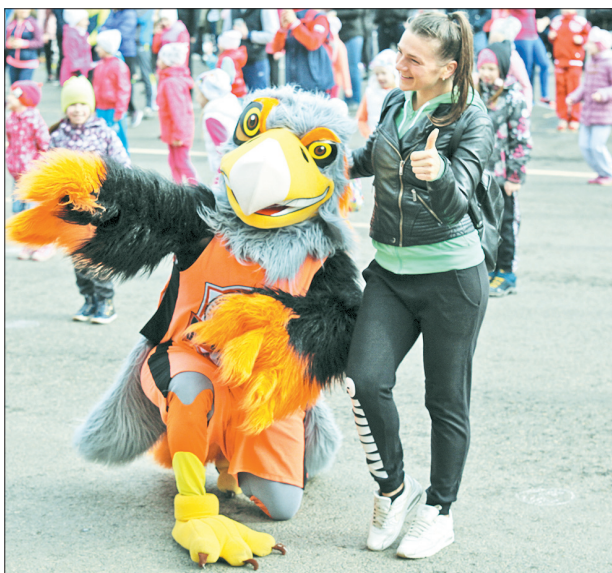
Талисман команды «Буревестник».