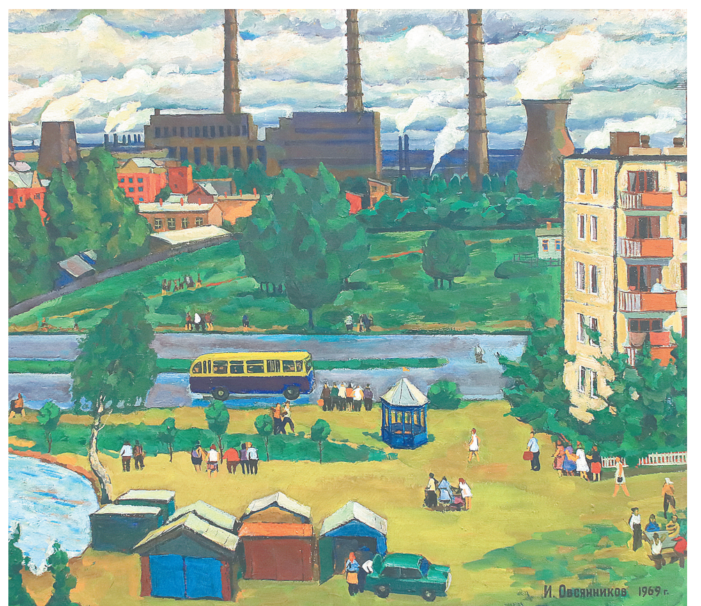
«Утро». 1969 г.