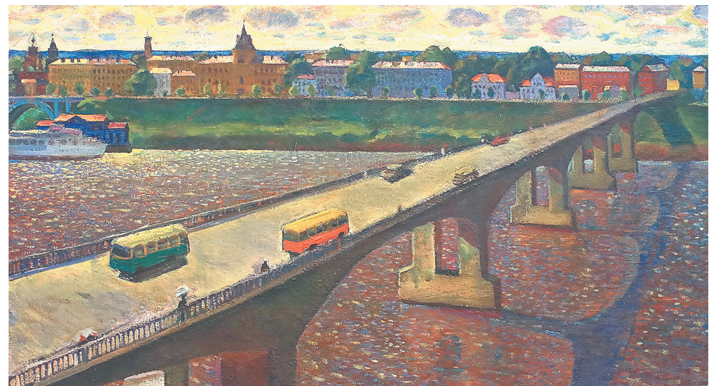
«Волга. Мост». 1967 г.