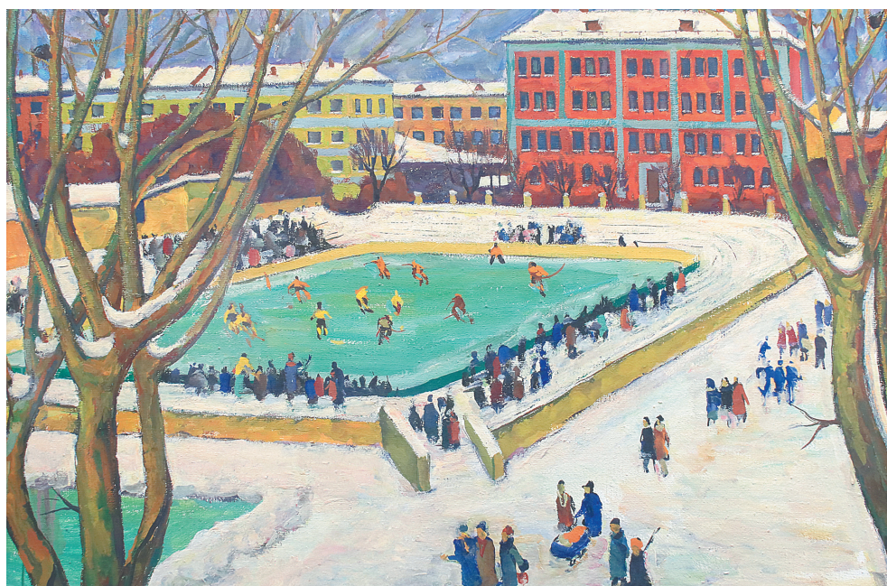
«Воскресный день». 1971 г.

Собеседник, документальное издание Городские новости