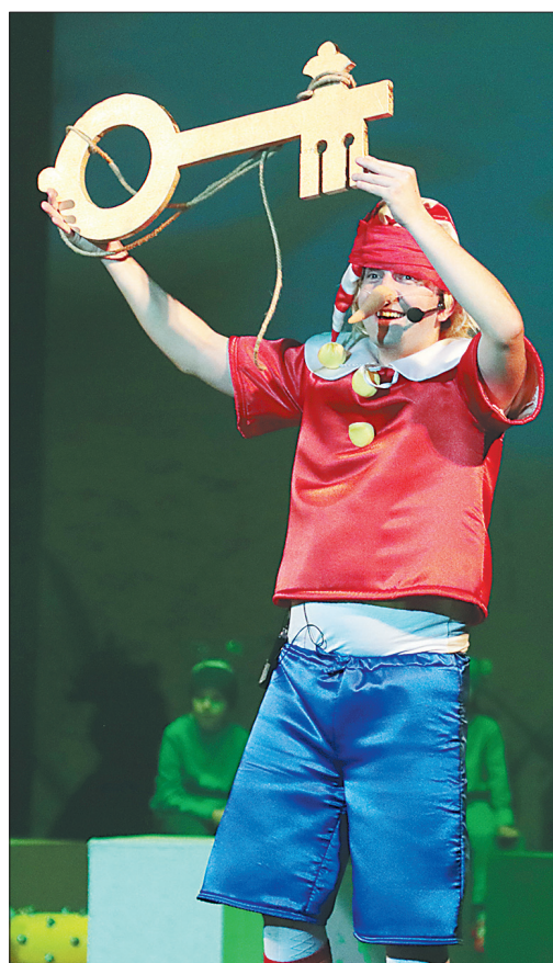
Сцена из спектакля.