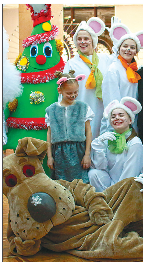
В фойе было весело.