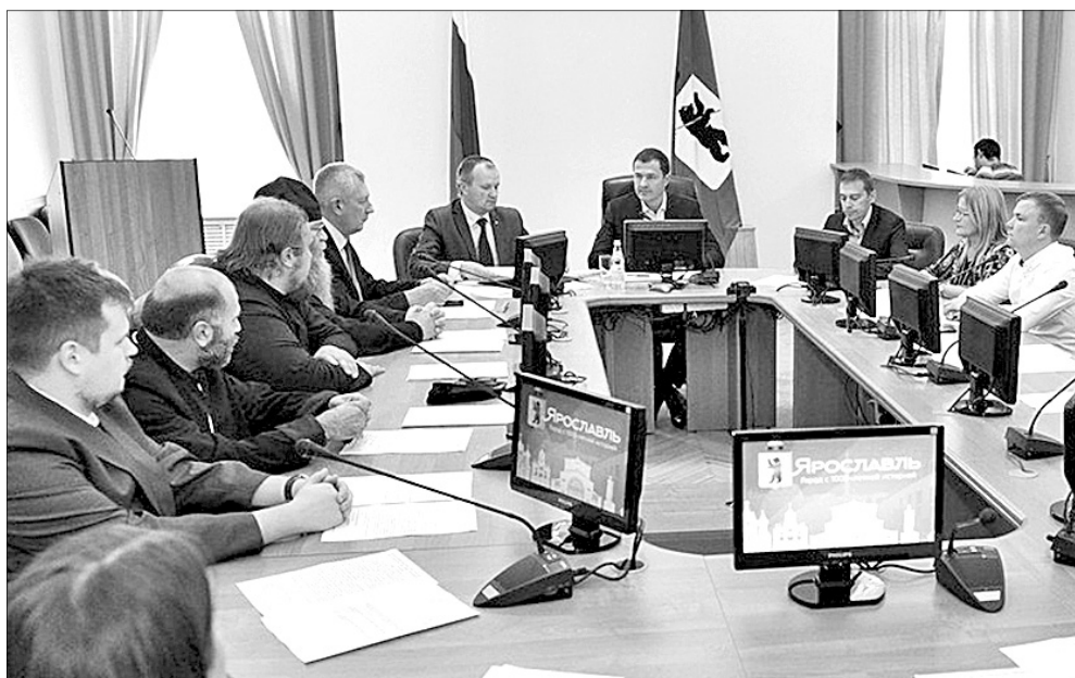
Идет заседание Совета.