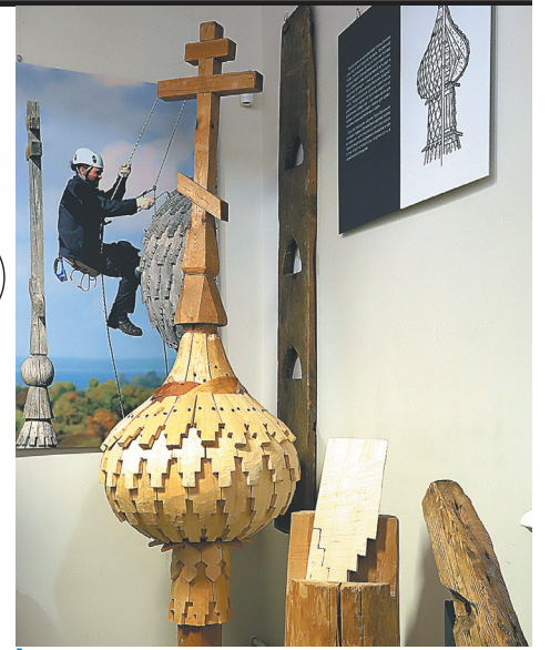
«Чешуя» черепицы сделана из осины.

На протяжении 10 лет реставрировались и интерьеры памятника. В церкви никогда не было роскошного убранства, единственное украшение – иконостас с золоченой резьбой (самый большой в России!) и роспись на потолке. Иконостас четырехрядный: 7 метров в высоту и 25 в длину, он располагается на семи стенах, как бы обнимая прихожан. После демонтажа его буквально собирали по кусочкам. Восстановленные элементы покрыли сусальным золотом и наложили тонировку. В иконостасе 193 детали и 11 икон подлинного северного письма. А еще расписное «небо», замыкавшее круглый потолок. Последнее, правда, пока можно созерцать только виртуально, с помощью дополненной реальности. 16 расписных клиньев «неба» погибли в период Великой Отечественной войны – ими топил печь сторож склада в Петрозаводске. А вот так называемые направляющие тябла «неба» – разделительные элементы между иконами – сохранились в подлинном виде и находятся в хранилище. Сохранилось и замковое кольцо, куда вставлялись иконы. На нем молитва «Отче наш», написанная в зеркальном отражении. Есть версия, что ее слова могли отражаться в купели. ■