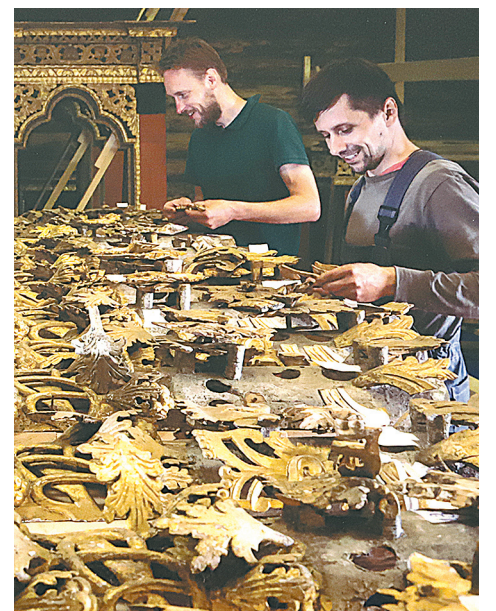
Восстановление элементов декора.