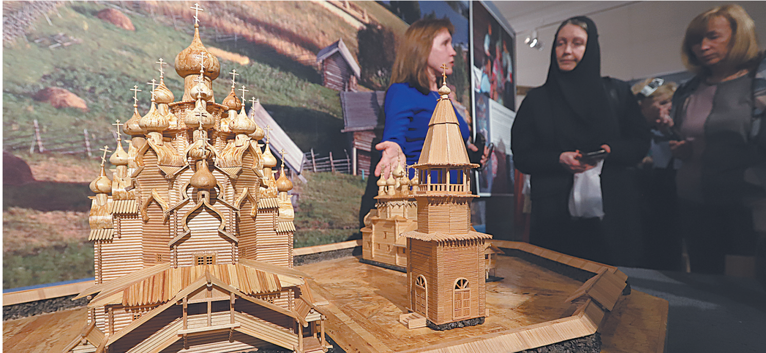
Церковь Преображения Господня в Кижях стала воплощением представления крестьян о красоте и гармонии.