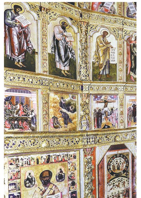
Иконостас с золоченой резьбой.