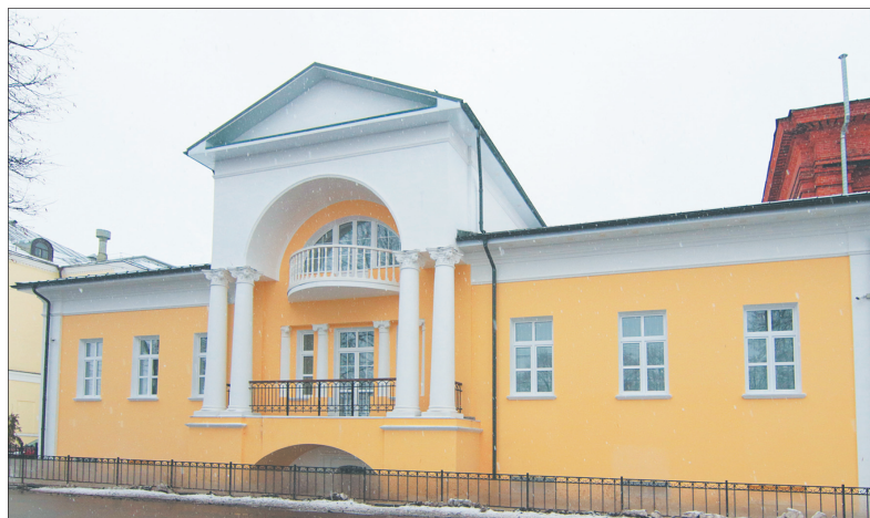
Музей расположен в Доме общества врачей на Волжской набережной.

В бывшем Доме общества врачей открылся частный музей имени Вадима Орлова