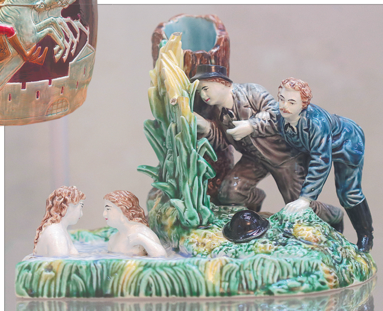
Подставка под карандаши «Парни, подглядывающие за купальщицами». Товарищество М.С. Кузнецова, конец XIX – нач. XX вв., фаянс.