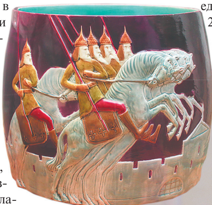
Кашпо «Богатырское», рубеж XIX–XX вв. Товарищество М.С. Кузнецова, фаянс.