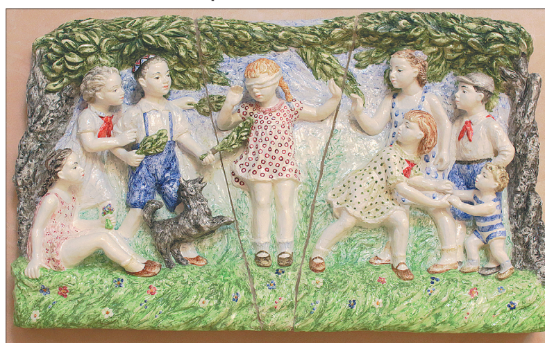
Декоративный пласт «Игра в жмурки», Конаково, М.П. Холодная, 50-е годы, фаянс.