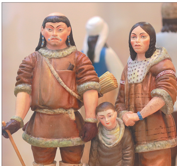
«Оленные чукчи» из серии «Народы России», Россия, з-д Гарднера, 1870-1890-е гг.