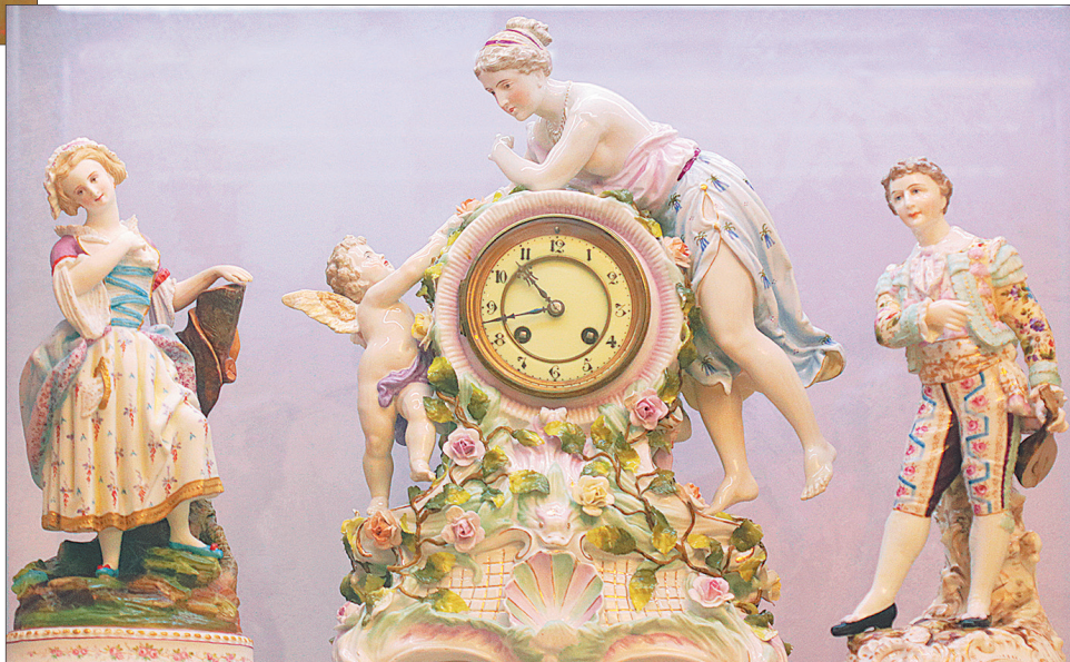
Подчасник «Венера и Амур», Германия, до 1906 г., фарфор.