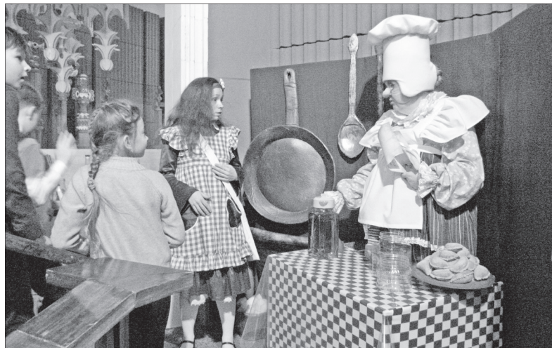
Все яства были бутафорскими.

Четвероклассники 33-й школы стали первыми участниками квеста «Сыграем в Алису». Эксклюзивный проект в кукольном театре буквально за месяц воплотил в жизнь его главный режиссер Алексей Смирнов, давней мечтой которого было поставить «Алису в стране чудес» — единственную сказку в мире, переведенную на 135 языков и занимающую второе место по тиражу после Библии.