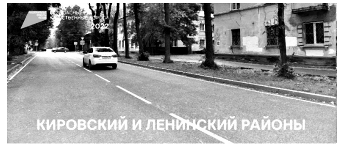
КИРОВСКИЙ И ЛЕНИНСКИЙ РАЙОНЫ