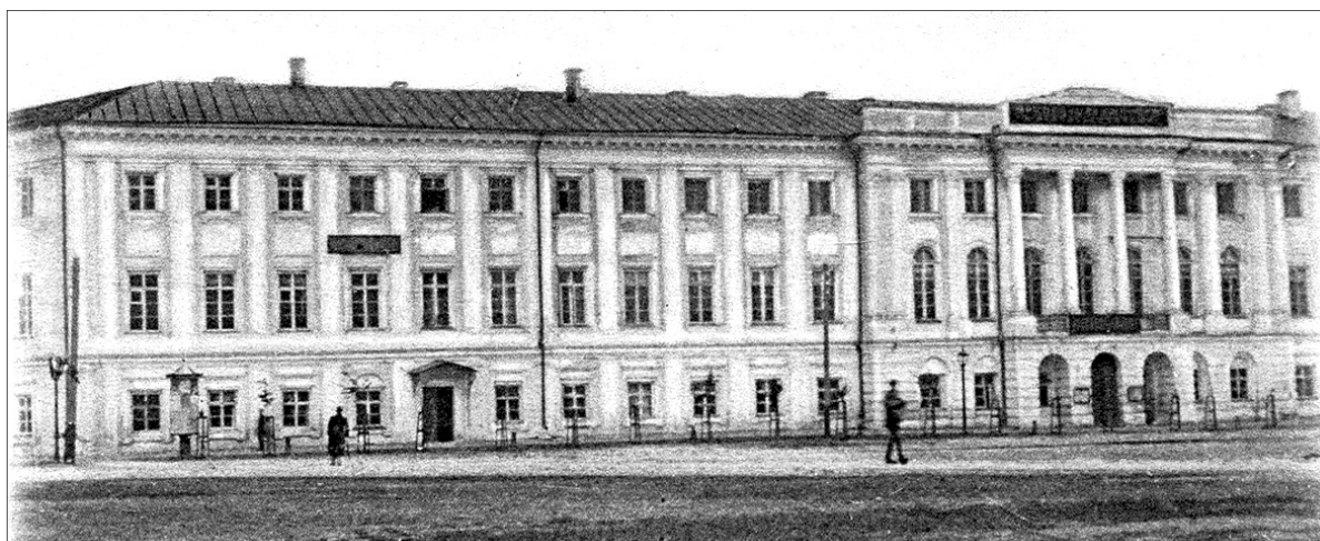
Присутственные места на Ильинской площади (ныне Советская площадь).