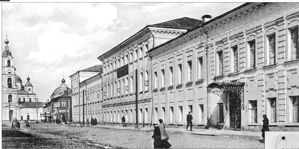
Дом призрения ближнего в Ярославле (ныне улица Кирова, д. 8/10).