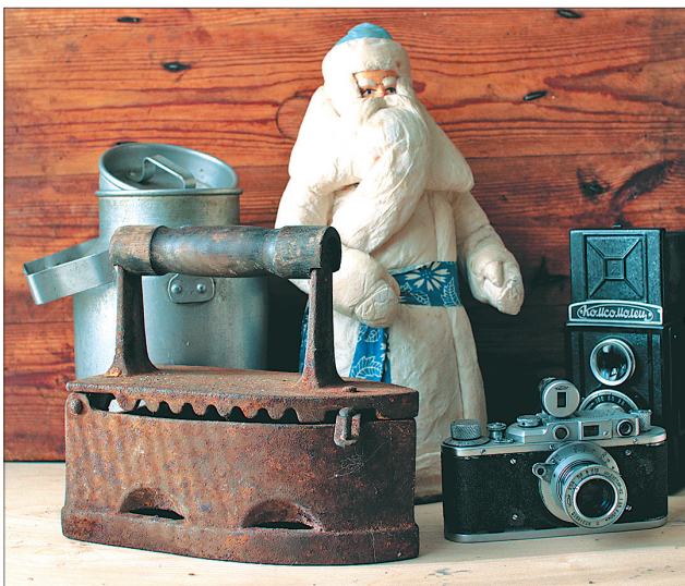
Такие предметы еще недавно были в каждой семье.

Второй — более приличный с виду — блошиный рынок открывается по субботам и воскресеньям на подходе к рынку Дзержинского района. Там продавцы раскладывают свой нехитрый товар на прилавках. На оба рынка в поисках раритетов навешиваются и антиквары.