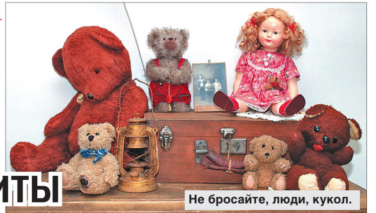
Не бросайте, люди, кукол.