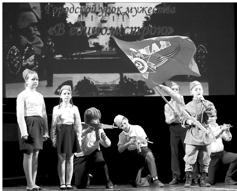
Театрализованное представление о Великой Отечественной войне.