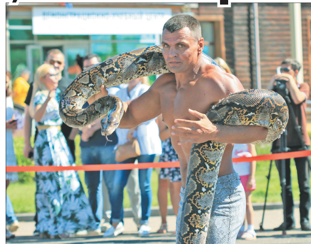
Выступление каскадера с рептилиями.