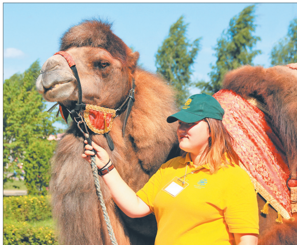
На верблюде можно было покататься.