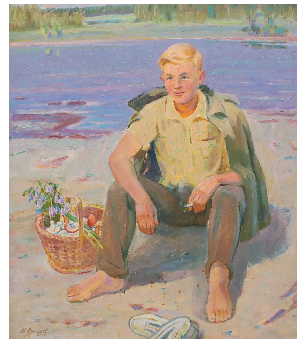
Николай Еремеев. «Пора грибная».

Выставка «Страна в лицах» в Центральном выставочном зале Союза художников проводится в рамках реализации проекта «Арт-галерея. Ярославль» при финансовой поддержке министерства социальных коммуникаций и развития некоммерческих организаций Ярославской области в рамках государственной программы «Развитие институтов гражданского общества Ярославской области» на 2021 – 2025 годы.