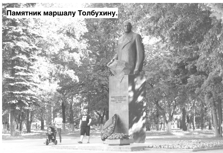
Памятник маршалу Толбухину.