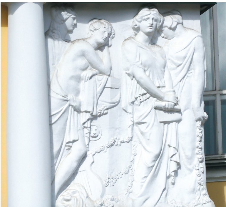
↓ Барельеф со львом на Волковском театре.