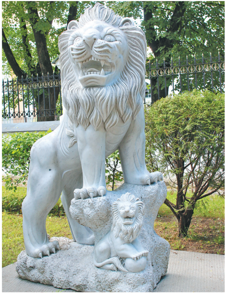
↓ Вьетнамские львы Губернаторского сада.