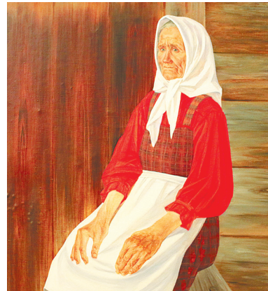
«Последний снег». Фрагмент триптиха.