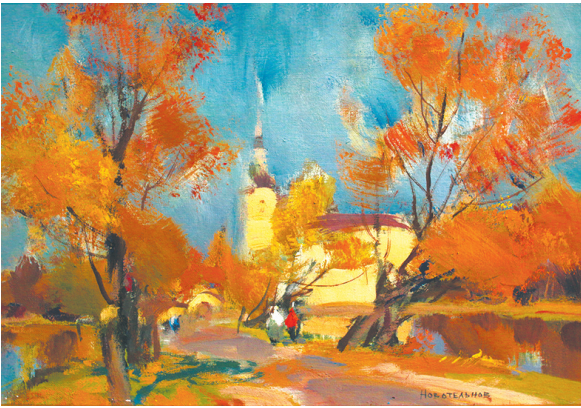
«Осень. Петропавловские пруды».