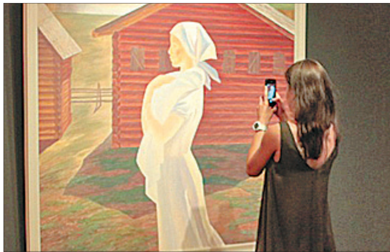
На выставке в музее.