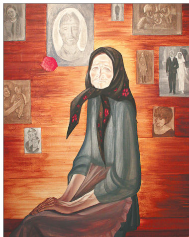
«Корень рода (семья)».