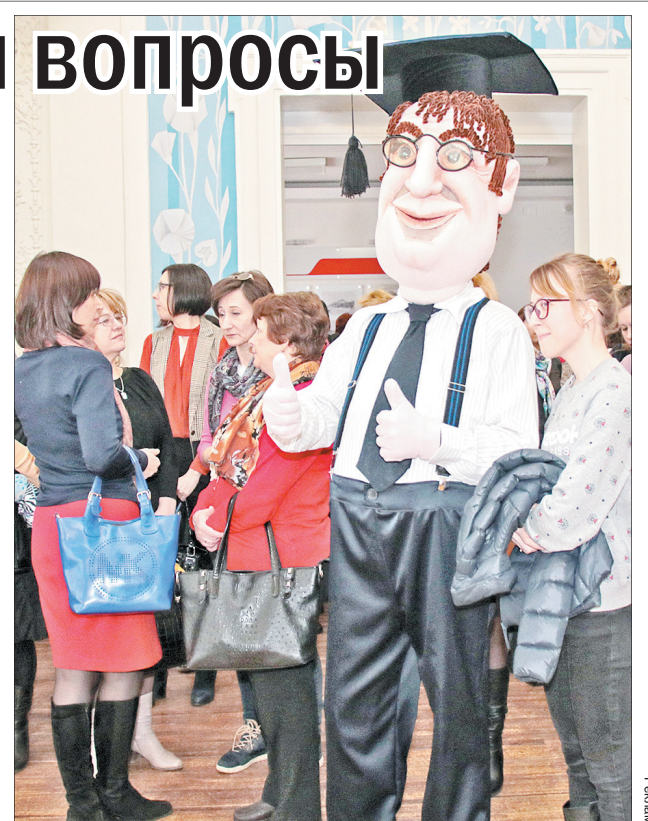
Бессменный символ Сети КонсультантПлюс.

Изменения в законодательстве происходят постоянно. Чтобы быть хорошим специалистом, любому бухгалтеру нужно быть в курсе изменений, читать профессиональную литературу, посещать обучающие семинары, ведь живое общение с коллегами не заменит сухих книжных строчек. В общении можно не только расширить свои профессиональные знания, но и поделиться личным опытом. На прошлой неделе в Доме культуры железнодорожников собрались пред-