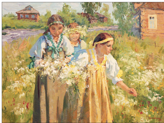
Т. Лушников. «На празднике».

по манере и почерку, которых объединяет помимо всего чуткое отношение к человеку. Деятельность товарищества не ограничивается только проведением выставок. Это ма-