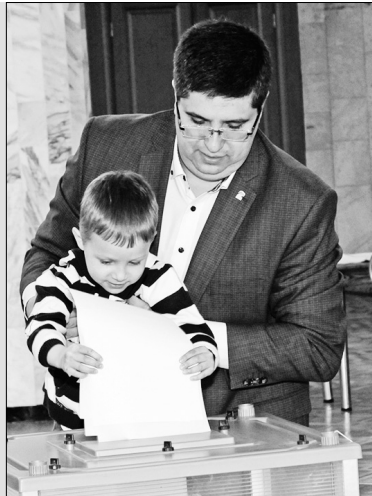
Голосую с папой!

Предварительное голосование 22 мая в Ярославле прошло активно, демократично, открыто, конкурентно и честно. Очень важно, что праймериз «Единой России» привлекли не только членов партии: любой гражданин мог заявиться как участник и прийти на выборы как избиратель.