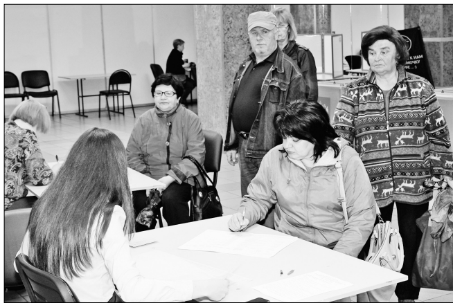
Праймериз в Ярославле прошли организованно.

Простой, но показательный ответ, ярославцы заинтересованы в дальнейшем развитии родного города, области и всей России.