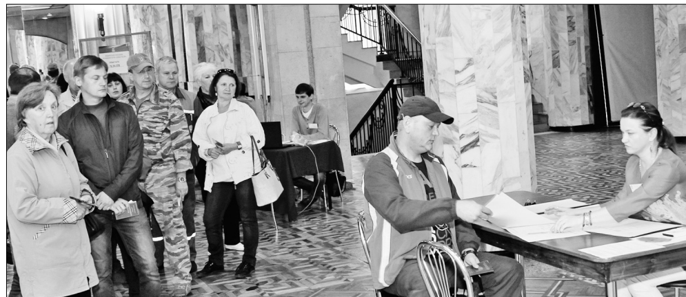
К обеду на избирательных участках уже были очереди.