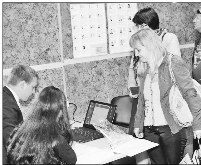
На 170 избирательных участках Ярославля работали 820 членов счетной комиссии.