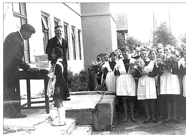
Последний звонок. 1966 год.