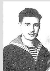
Во время войны.

...У меня сохранились произведения А.П. Чехова, где на полях папиной рукой указаны дата и время, когда он читал эту книгу. Меня тогда еще поразило, что 12-летний мальчик зимним вечером коротает время за чеховской повестью «Цветы запоздалые».