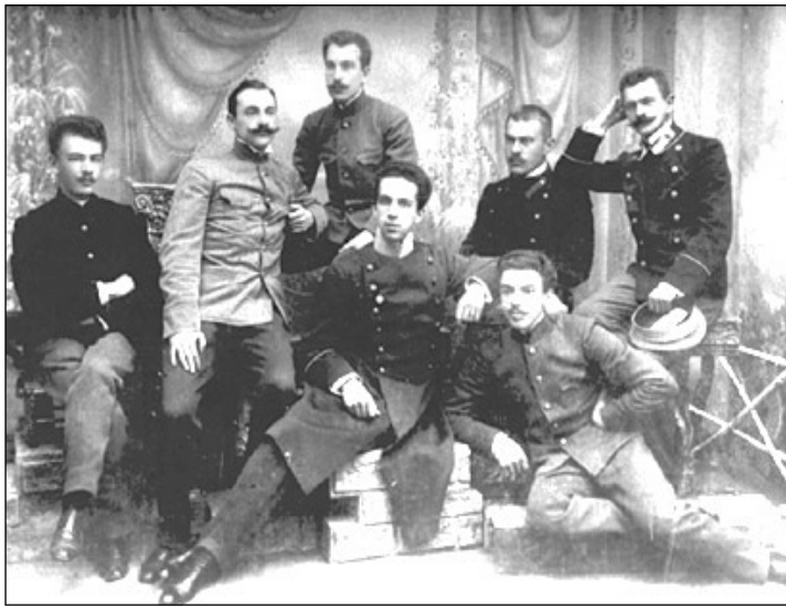
Студенты XIX века.