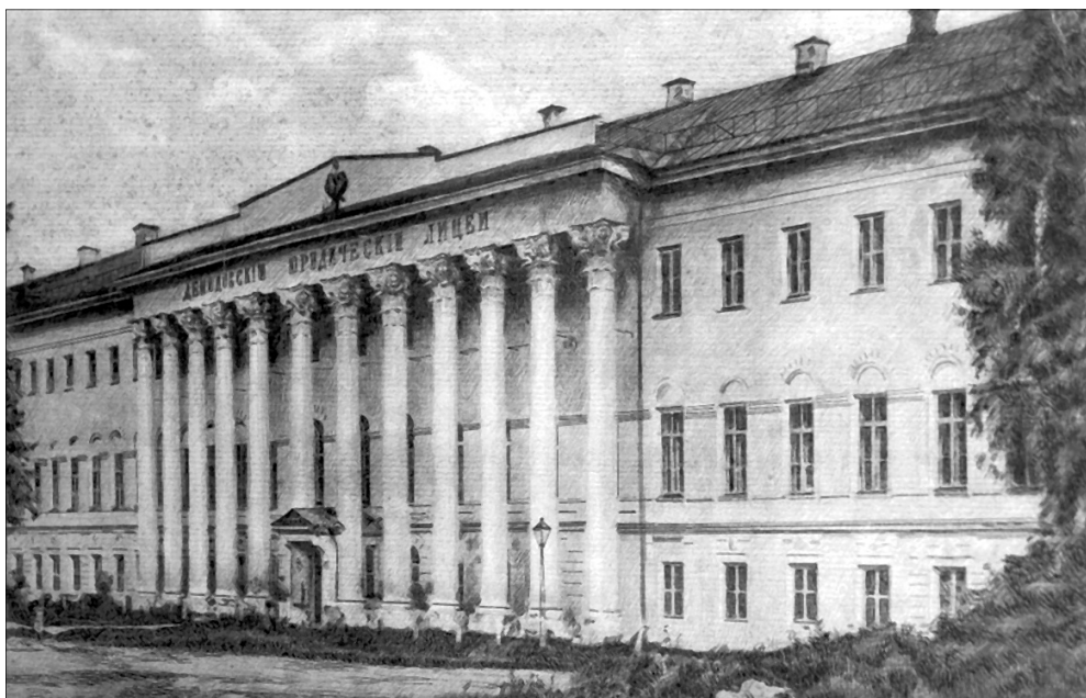
Демидовский университет был разрушен в 1918 году при подавлении мятежа.

• Еще одной традицией этого дня был своеобразный «приворот» на понравившегося парня: девушка делала венчик из сухих трав, прутиков и тряпочек и прятала его в доме потенциального жениха. Будущая свекровь должна была отыскать метелку: считалось, что если ей это не удастся, то быть свадьбе.