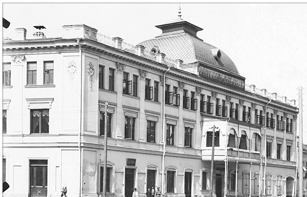
Ярославские студенты особенно любили отмечать свой праздник в ресторане гостиницы «Царьград».