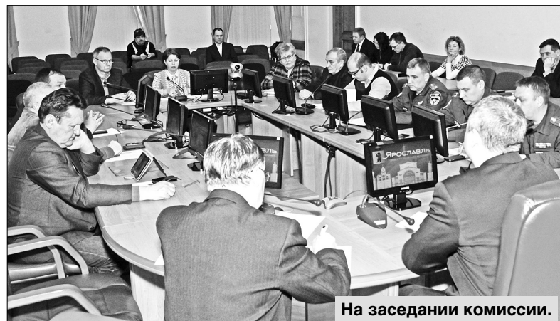
На заседании комиссии.

Особое внимание специалисты комиссии уделили эпидемиологической ситуации в Ярос-