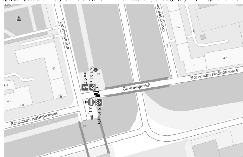
Схема организации одностороннего дорожного движения по Волжской набережной города Ярославля на участке от дома № 2 по Красному съезду до улицы Первомайская

Приложение к приказу директора департамента городского хозяйства мэрии города Ярославля от 05.08.2022 № 135