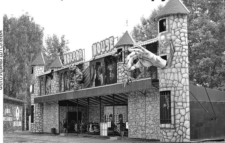
Комната страха - новый аттракцион на Даманском.

В ярославских парках продолжается благоустройство, появляются новые аттракционы. Программа развития парков рассчитана на два года.