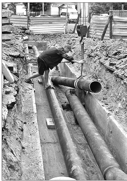
Во дворе на ул. С. Орджоникидзе кипит работа.

Кроме ремонта этих двух дворов в рамках губернаторского проекта «Решаем вместе» в Заволжском районе также выполняется ремонт парковочных карманов и тротуаров еще в девяти дворах.