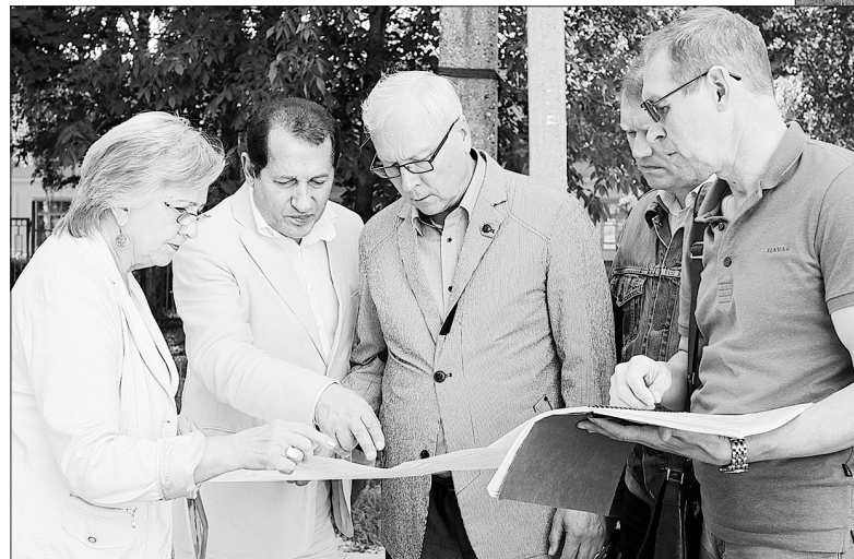
Комиссия на ул. Красноперекопской.

Комплексный ремонт городских дворов в рамках губернаторского проекта «Решаем вместе» проверила на прошедшей неделе комиссия.