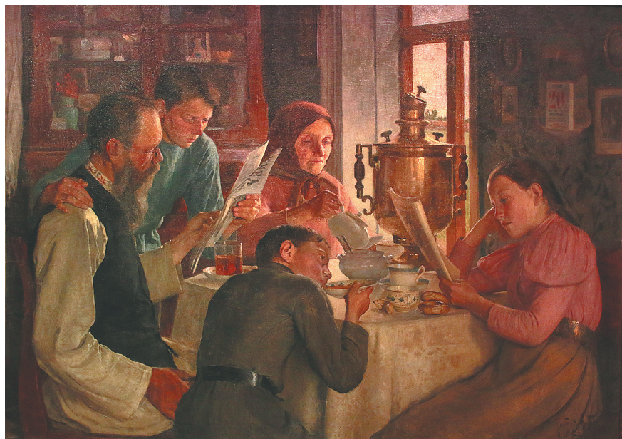
«За семейным столом». Исаак Батюков.