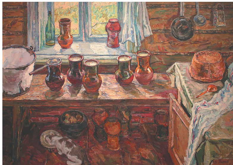
«В избе». Владимир Ульянов.