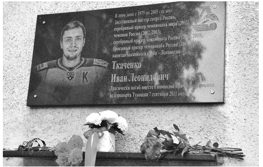
↓ Мемориальная доска на доме, где жил Иван Ткаченко.