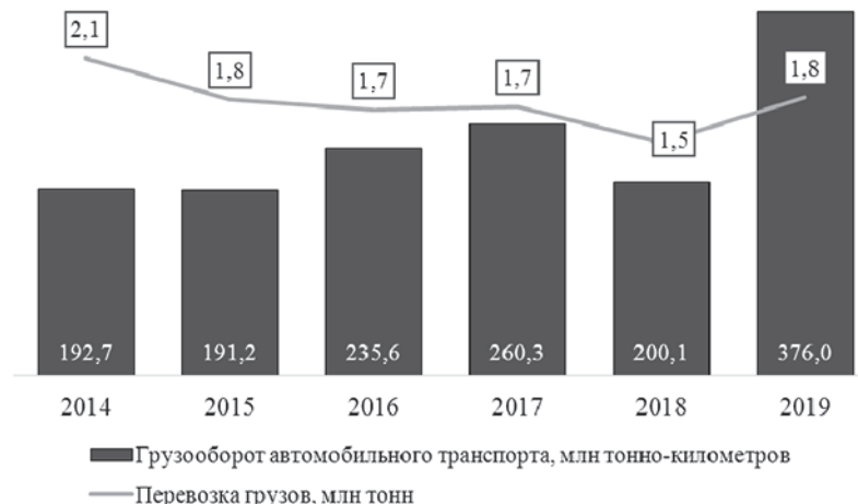
Рис. 1.12 – Динамика грузооборота автомобильного транспорта и перевозок грузов (без субъектов малого предпринимательства) в городе Ярославле

Грузооборот автомобильного транспорта организаций всех видов экономической деятельности (без субъектов малого предпринимательства) в 2015 - 2019 годах показывал рост (за исключением спада в 2018 году, когда он сократился по сравнению с 2017 годом на 17,7 %) и на 2019 год составил 376 млн тонно-км. Перевозка грузов с 2014 года снизилась на 12 % (рис. 1.12).