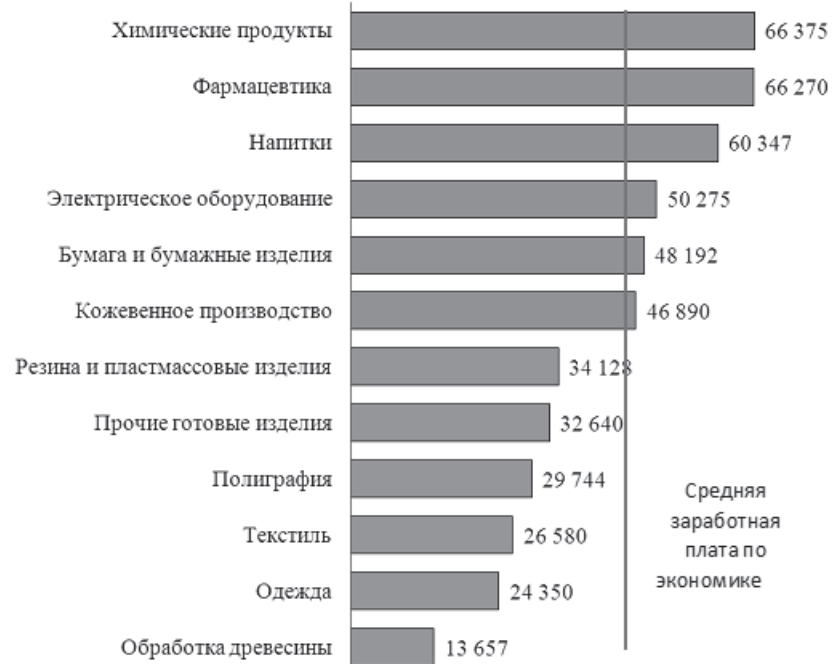
Рис. 1.11 – Среднемесячная начисленная заработная плата в отраслях обрабатывающей промышленности (без выплат социального характера) города Ярославля в 2019 году

Самые высокие среднемесячные начисленные заработные платы зафиксированы в производстве химических продуктов, фармацевтике, а также производстве напитков и электрического оборудования. Наименьшие среднемесячные заработные платы получают работники организаций, занимающиеся обработкой древесины, а также производством одежды и текстильных изделий (рис. 1.11).