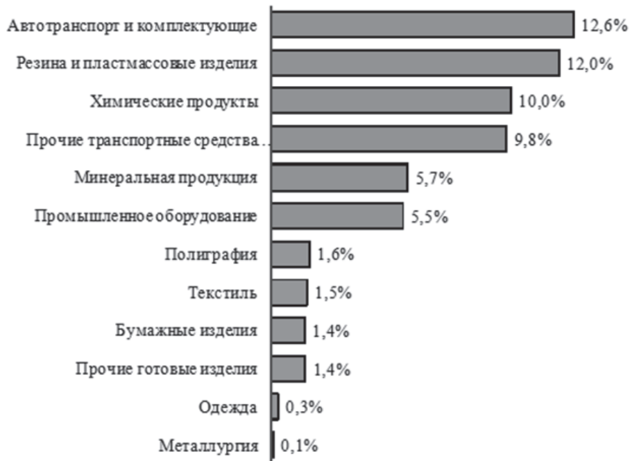
Рис. 1.9 – Удельный вес отдельных отраслей в общем количестве замещенных рабочих мест в организациях обрабатывающей промышленности города Ярославля в 2019 году

В структуре отраслей обрабатывающей промышленности наибольшая занятость в 2019 году в производстве автотранспорта и комплектующих (12,6 % от общего количества занятых в обрабатывающей промышленности), резины и пластмассовых изделий (12,0 %), химической продукции (10,0 %). Наименьшая – в металлургии (0,1 %), производствах одежды (0,3 %), прочих готовых изделий (1,4 %) и бумажных изделий (1,4 %) (рис. 1.9).