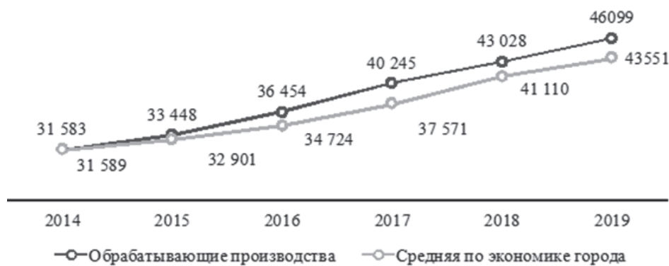
Рис. 1.10 – Динамика среднемесячной начисленной заработной платы работников организаций (без выплат социального характера) по обрабатывающим производствам и по экономике города Ярославля, руб.

С 2015 года среднемесячная начисленная заработная плата работников организаций (также как синонимы используются термины «среднемесячная заработная плата», «средняя заработная плата», «средняя оплата труда») по обрабатывающей промышленности стала выше средней заработной платы по экономике города. В 2019 году она составила 46 099 руб. (на 5,9 % выше средней) (рис. 1.10).