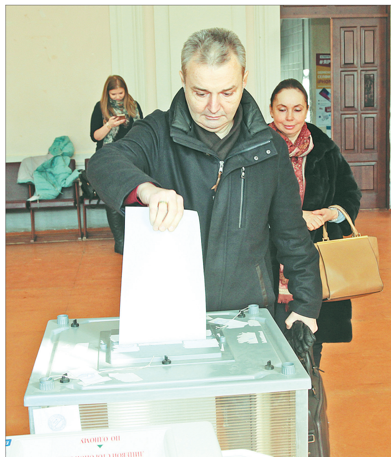
Игорь Каграманян, сенатор от Ярославской области.