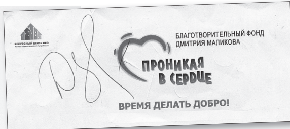
Автограф Д. Маликова для читателей газеты «ГН».