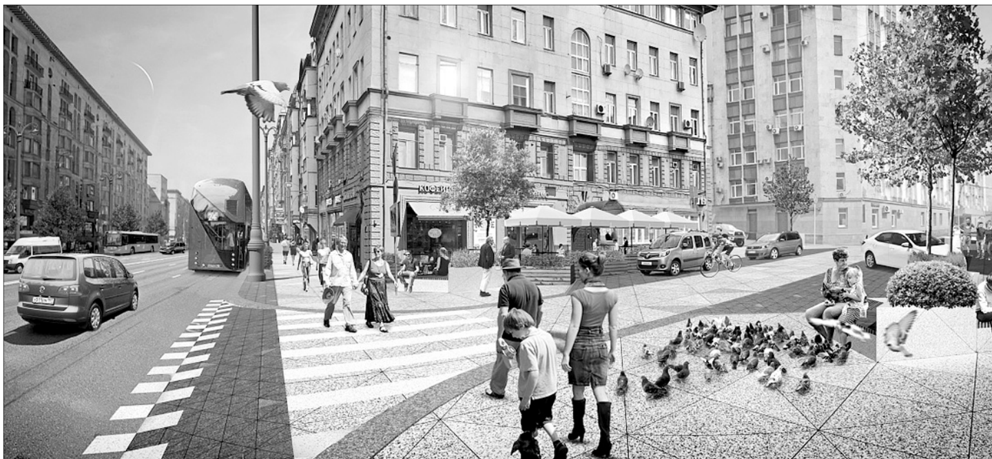
Тверская улица в проекте ярославских архитекторов.