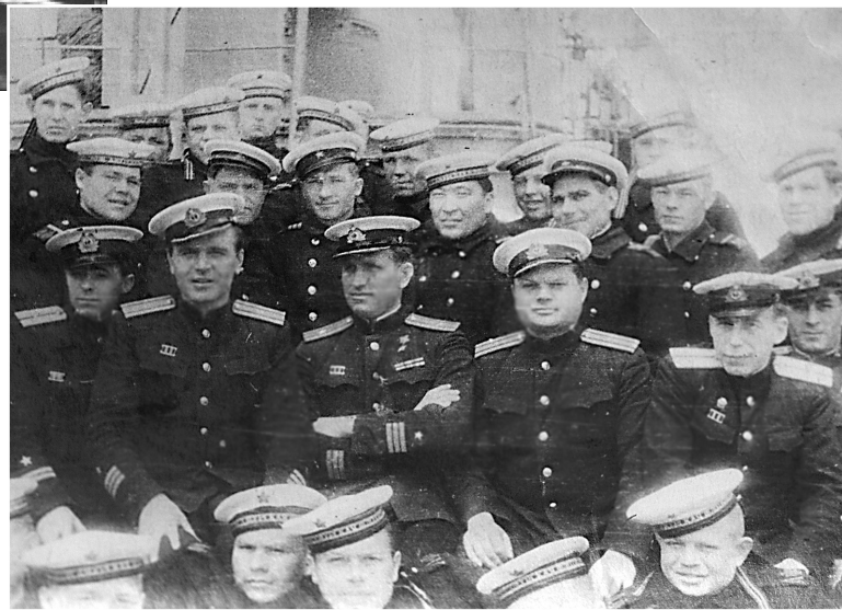
Личный состав гвардейского монитора «Сун-Ят-Сен».