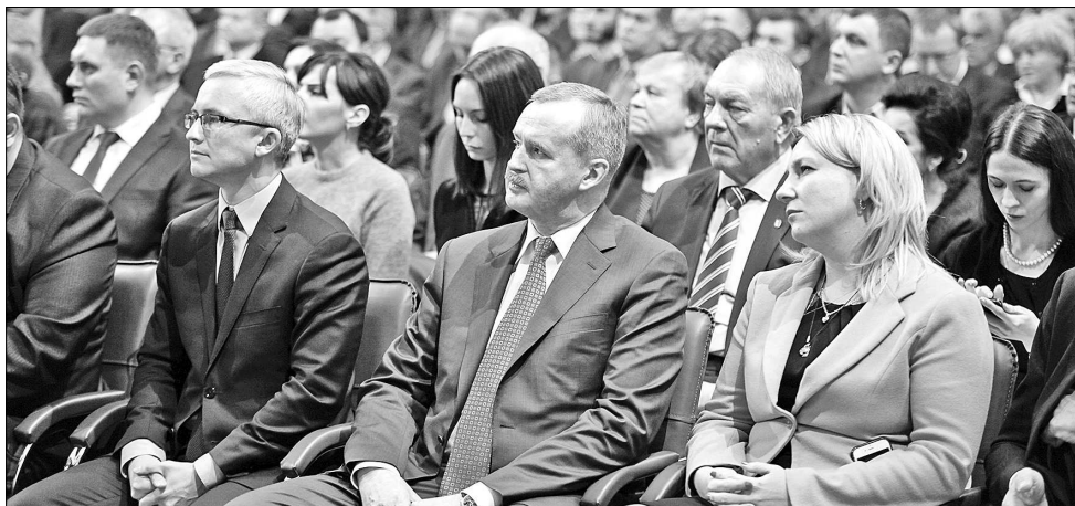
В КЗЦ «Миллениум».

Первое и самое важное направление, — это рост экономики. В этой связи нужно обеспечить устойчивую загрузку предприя-