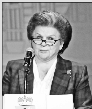
Валентина ТЕРЕШКОВА, депутат Госдумы РФ, первая женщина-космонавт:

В зале КЗЦ «Миллениум» присутствовали депутат Государственной думы РФ Валентина Терешкова, члены правительства и Общественной палаты Ярославской области, главы муниципальных образований, руководители ведущих предприятий города, представители общественных организаций. Они прокомментировали заявление главы региона и Программу социально-экономического развития области.