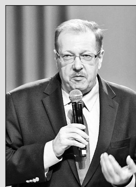
Александр РУСАКОВ, ректор ЯрГУ имени Демидова: