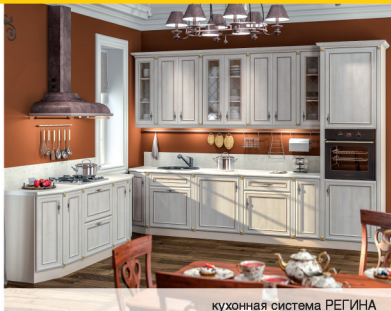
кухонная система РЕГИНА