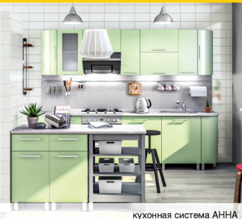
кухонная система АННА