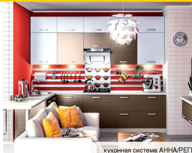
кухонная система АННА/РЕГИНА