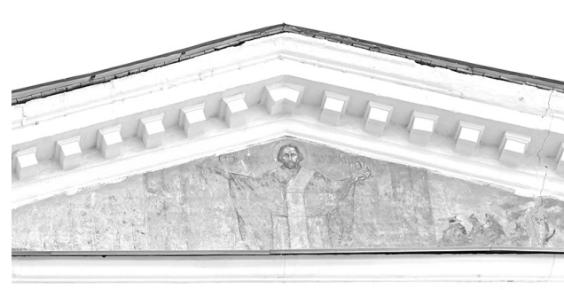
Фрески с западной стороны.