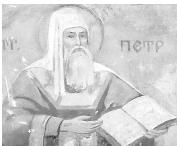
Лики на фресках.