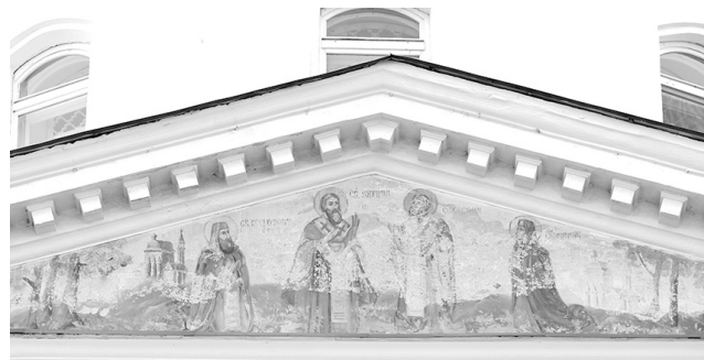
Фрески с северной стороны.