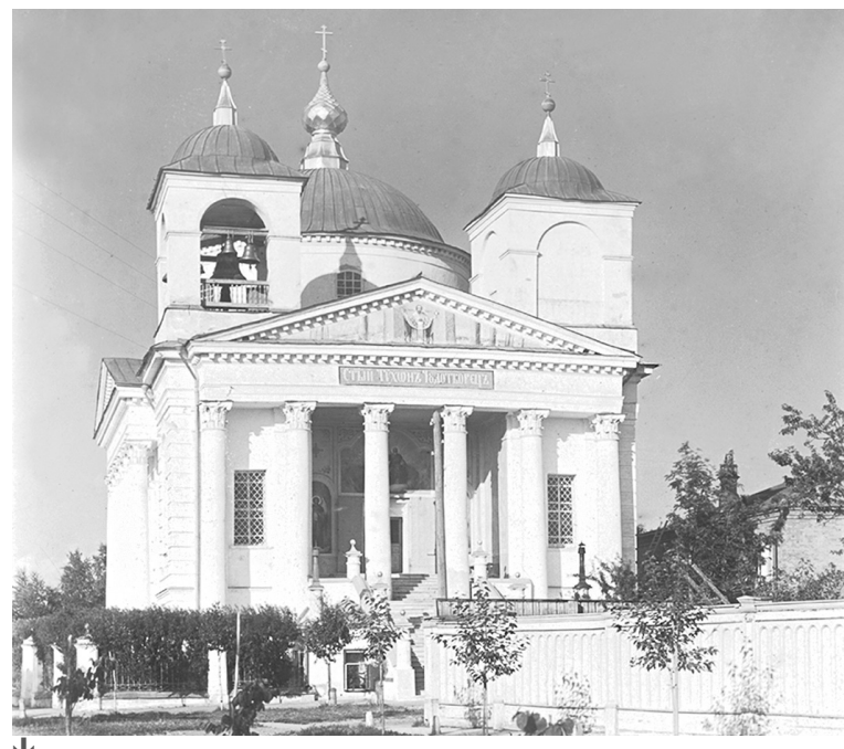
Ильинско-Тихоновская церковь. Начало XX века.