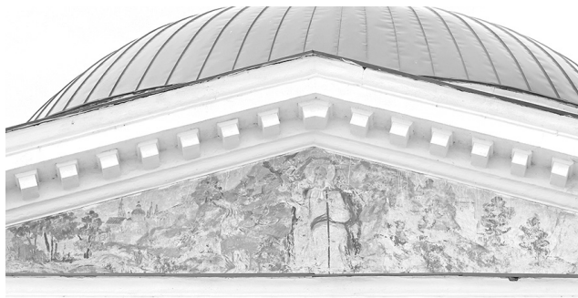
Фрески со стороны Волги.