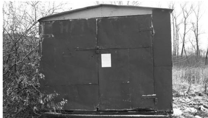
Извещение наклеено. (Ф.И.О., должность, подпись гражданина или уполномоченного представителя юридического лица, самовольно установившего объект)

Извещение о демонтаже и (или) перемещении самовольно размещенного объекта, не являющегося объектом капитального строительства, и освобождении земельного участка « 01 » ноября 2022 года г. Ярославль Выдано: владелец не установлен (данные лица, самовольно разместившего объект: Ф.И.О. - для гражданина; наименование, адрес – для юридического лица) в отношении самовольно размещенного объекта гараж (наименование незаконно размещенного объекта) расположенного по адресу: город Ярославль, 29-я линия пос. 2-е Брагино, напротив д.1/45 (на пересечении с 16-й линией пос. 2-е Брагино) В соответствии с приказом председателя комитета по управлению муниципальным имуществом мэрии города Ярославля от 21.10.2022 года № 4142 предлагаем в срок до «15» ноября 2022 года Вашими силами и средствами демонтировать самовольно размещенный Вами объект и освободить земельный участок. В случае невыполнения требования о демонтаже и (или) перемещении самовольно размещенного объекта, объект будет демонтирован и (или) перемещен в принудительном порядке. Об исполнении требования, изложенного в настоящем извещении, необходимо уведомить территориальную администрацию Дзержинского района мэрии города Ярославля в срок до 15 ноября 2022 года (телефон ТА 40-94-45, 40-94-03) . Извещение наклеено. (Ф.И.О., должность, подпись гражданина или уполномоченного представителя юридического лица, самовольно установившего объект)