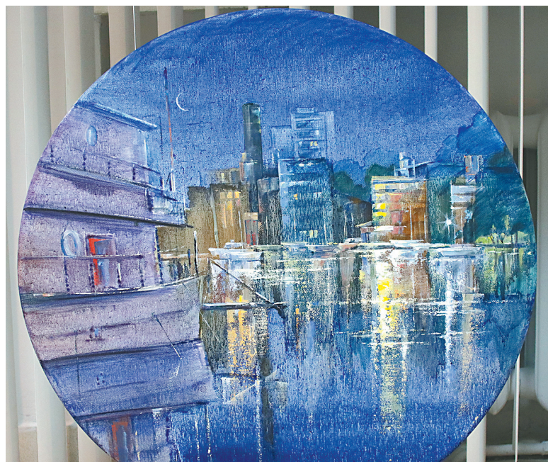
↓ «Mystery city».