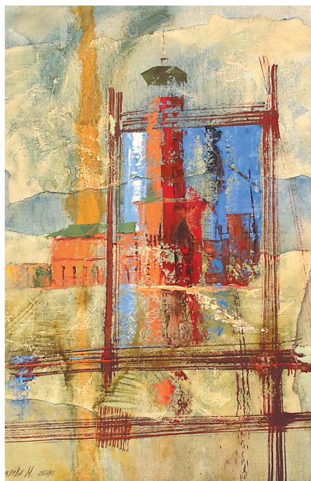
↓ «Старый город».